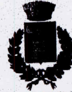
Comune di Cefalà Diana