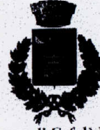
Comune di Cefalà Diana