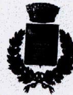
Comune di Cefalà Diana