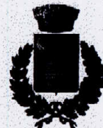
Comune di Cefalà Diana