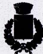
Comune di Cefalà Diana