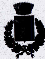
Comune di Cefalà Diana