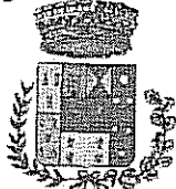
Comune di Bolognetta