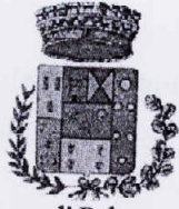
Comune di Bologneta