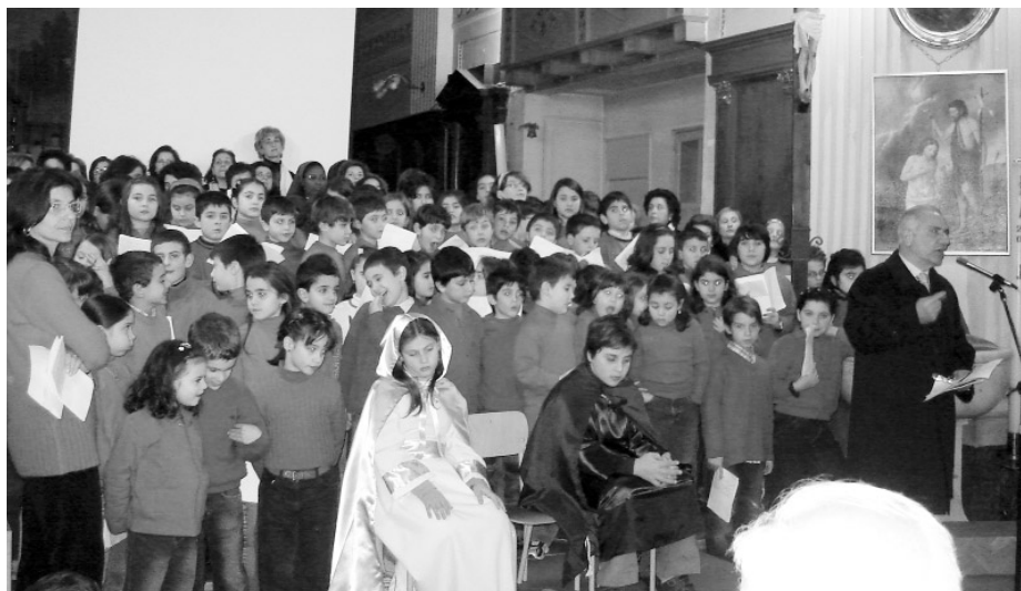
Un momento della manifestazione

Si è voluto tendere la mano agli anziani, ai malati, alle persone sole, a quelle in scoramento perché sentissero tutta la Scuola al loro fianco per confortarli, come amici